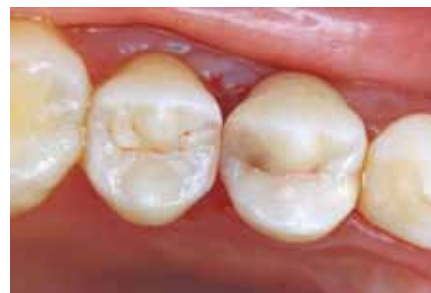
Готовая реставрация из Полофил Супра